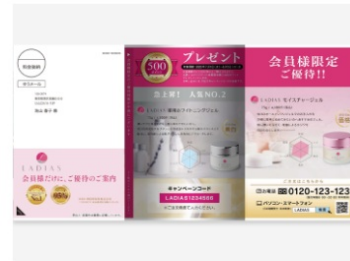
はがき圧着Zタイプ