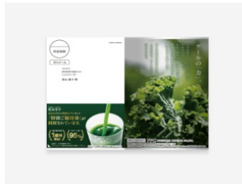
はがき圧着Vタイプ